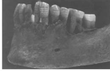
Fig. 1 b. Transverse linear enamel hypoplasias in lower teeth of an individual from Straubing (Strb-791).

استخدام الساكين، والكثير منهم يستخدمون الأسنان كأدوات في فتح عل الصفيح أو نزع أغطية براميل البزير المعدنية التي يصعب فتحها باستخدام الأدوات المعدنية 31 .