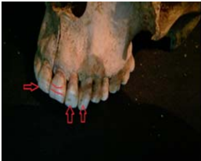
شكل (١٠): مرض نقص تكون المينا.