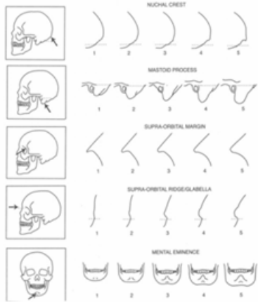
Figure 6. Scoring system for sexually dimorphic cranial features (after Ansell and Nordland 1976, Figure 16).

من أشهر طرق تحديد الجنس من خلال الجمجمة هي طريقة بويكسترا و أوبيلاكرا ، فهي تعتمد علي الطرق الوصفية للجمجمة لتحديد الجنس 38 .