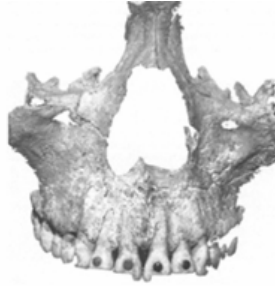
Fig. 17. Mutilations of maxillary anterior teeth in a skull from Tlatzala, Mexico, 500-900 AD. Dental inlays of pyrit and jade; filing of incisors (from Lansing and Miller 1983).

والوشم وتمديد الرقبة وغيرها من التعديلات المنتشرة لدى مختلف الثقافات. وفي الآونة الأخيرة، في ضوء التكنولوجيا الحديثة توسعت تلك التعديلات وشملت تبيض الجلد ، وإزالة الشحوم ، وإعادة تشكيل ملامح الوجه ، بالإضافة إلى تغيير الجنس التناسلي. ولعل أكثر الممارسات انتشاراً هي التعديل المتعمد للأسنان التي تم توثيقها في إفريقيا وأوقيانوسيا وشرق آسيا والأمريكتين ١٩ . فعلى سبيل المثال عند بعض الثقافات الأفريقية يتم عمل برد Chipping للأسنان على شكل حرف V كدليل على القوة والشجاعة كتشبيهه بالأسود ٢٠ . ويعتبر برد الأسنان وتجميلها لدى شعب المكسيك له دلالة على الجمال لدى الرجال ٢١ .