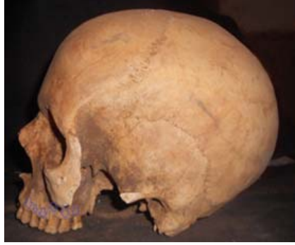
شكل (١١): تآكل الأسنان . الداعمة