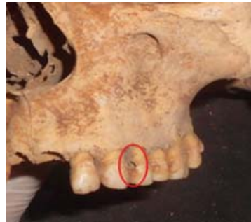
شكل (٩): تسوس الأسنان