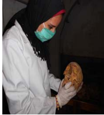
شكل (٨): الباحثة أثناء إجراء الدراسة العملية.