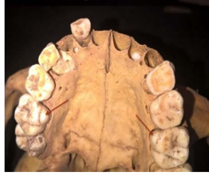
شكل (١٣): سمة نتوء كرابللي.