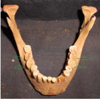
شكل (١٢): أمراض الأنسجة للأسنان.