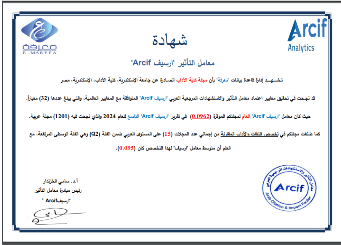
شكل (1) الشهادة التي حصلت عليها المجلة من إدارة قاعدة بيانات "معرفة"

كما صُنفت المجلة في تخصص اللغات والآداب المقارنة من إجمالي عدد المجالات (15) على المستوى العربي ضمن الفئة (Q2)، كما هو موضح بالشكل التالي: